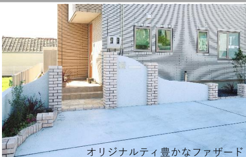
オリジナルティ豊かなファザード

レンガの門柱を柔らかいイメージで仕上げるため、温暖色であるフランを使いました。駐車場と建物を仕切る壁は、塗り壁に高さの違うレンガ柱を入れることでアクセントをつけ、壁のカーブを強調させ、よりデザイン性を高めています。隣地との境界である白い塗り壁が花を華やかに見せるためのスクリーンになっています。植栽は、季節ごとに花が咲くのはもちろん、色や形の異なる葉っぱを上手に組み合わせ、花がなくても美しく見えるよう工夫してあります。レンガ柱の上にお気に入りのガーデンアクセサリーや寄せ植えなどを載せてご家族で楽しんでいただいています。