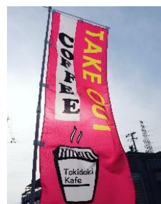
のぼりが目印です

オーダーをお受けしてから豆を挽き、こだわりの水（ミネラル・硬度・炭酸ガス・酸素などを適度に含み、日本人が美味しいと感じられる硬度10～100mg/Lの柔らかな水を使用）からハンドドリップでお淹れ致します。美味しい水から淹れられた体にやさしいコーヒーをご提供致します。