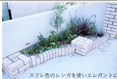
スフレ色のレンガを使いエレガントに

レンガの門柱を柔らかいイメージで仕上げるため、温暖色であるフランを使いました。駐車場と建物を仕切る壁は、塗り壁に高さの違うレンガ柱を入れることでアクセントをつけ、壁のカーブを強調させ、よりデザイン性を高めています。隣地との境界である白い塗り壁が花を華やかに見せるためのスクリーンになっています。植栽は、季節ごとに花が咲くのはもちろん、色や形の異なる葉っぱを上手に組み合わせ、花がなくても美しく見えるよう工夫してあります。レンガ柱の上にお気に入りのガーデンアクセサリーや寄せ植えなどを載せてご家族で楽しんでいただいています。